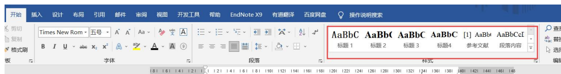
图 2.1 样式的具体说明

正文部分的内容采用样式“段落内容”。标题根据级别选择样式“标题 1”至“标题 4”。此后不对此再赘述。下就 word 中样式的使用简要说明：